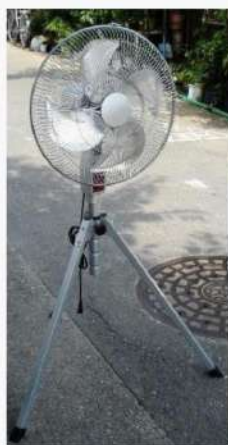
ハイスタンド扇風機