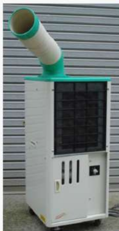
スポットクーラー