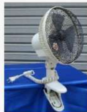
クリップ式扇風機