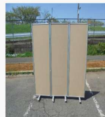
三つ折り パーティション