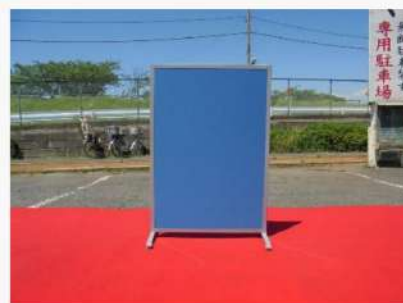
パーティション (間仕切り用)